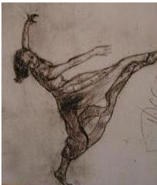
La ballerina, disegno di Sophie Scholl