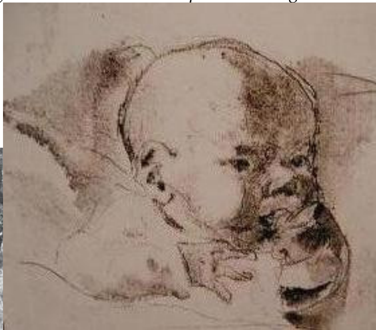
Sophie Scholl nel bosco - Il piccolo Dieter, disegno di Sophie Scholl, 1940